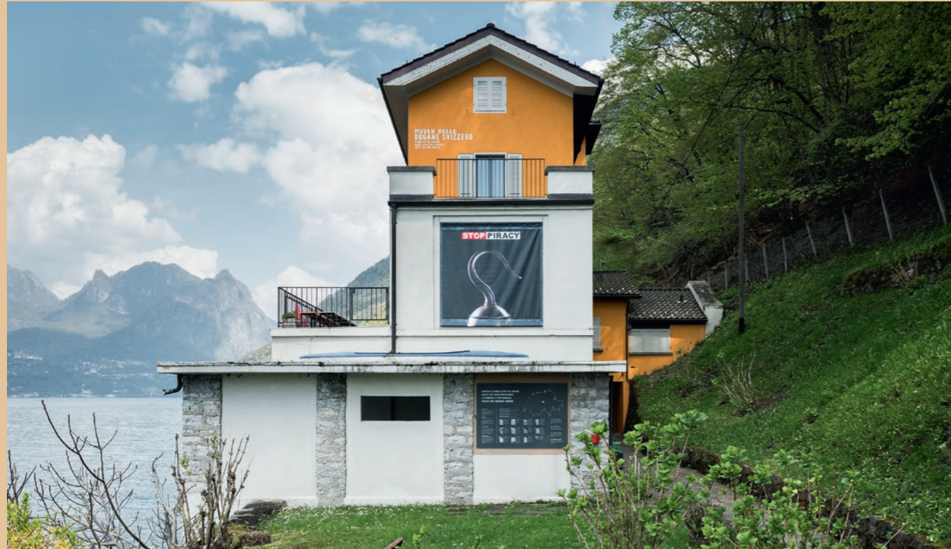
Impressioni della mostra speciale «Non è tutto oro quel che luccica» su contraffazioni e pirateria – Museo delle dogane svizzero a Cantine di Gandria, Lugano

Il Museo delle dogane svizzero si trova in un ex ufficio doganale dove, un tempo, le guardie di confine davano la caccia ai contrabbandieri. L'uncino ricorda a tutti che fino al 20 ottobre 2018 il museo è nelle mani dei falsari!