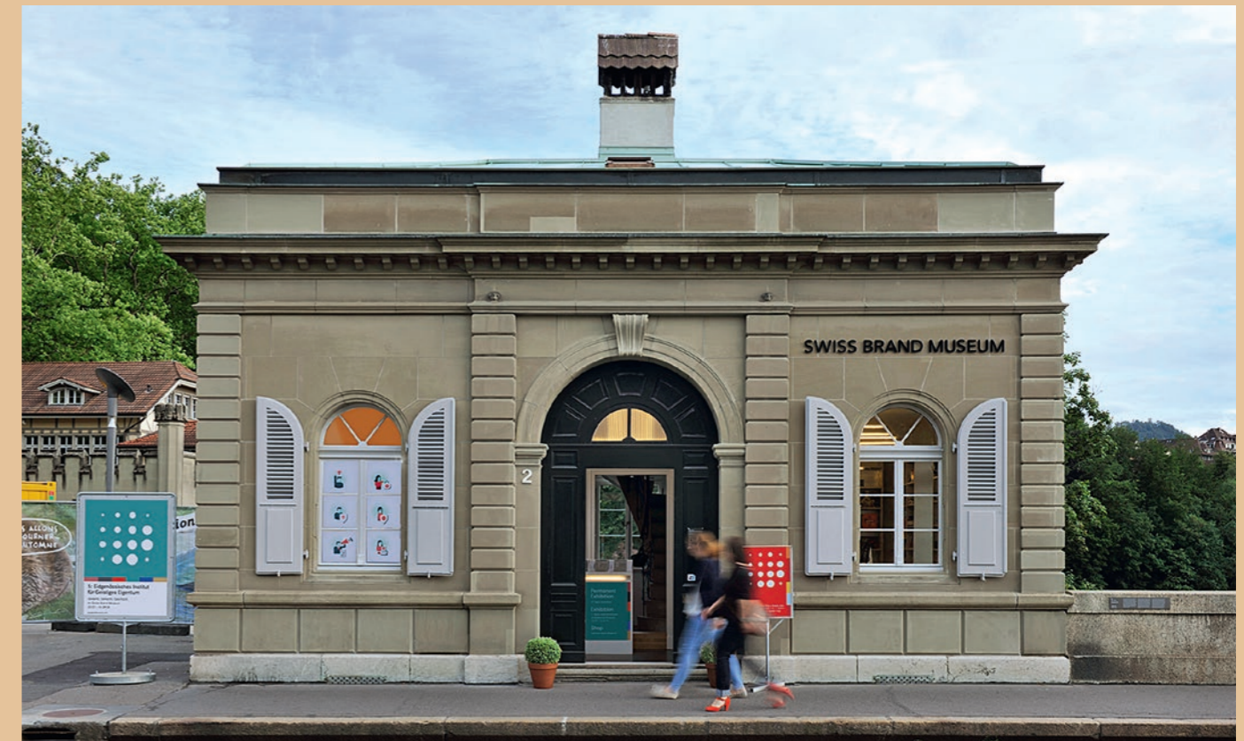
Swiss Brand Museum a Berna

I visitatori hanno avuto modo di scoprire le invenzioni esaminate da Albert Einstein nei suoi anni di attività presso l'IPI. Alcuni prodotti, tra cui il velcro, sono stati esposti insieme al relativo fascicolo di brevetto per illustrare due momenti molto diversi del processo inventivo: il disegno tecnico e la sua realizzazione. La mostra ha dato spazio anche al design e al diritto d'autore. Lo Swiss Brand Museum allestisce mostre permanenti e temporanee dedicate ai principali marchi, alle innovazioni e alle istituzioni svizzeri. Il marchio è il segno distintivo per eccellenza di qualsiasi prodotto o servizio e permette di smarcarsi dalla concorrenza. Lo sviluppo di un marchio richiede